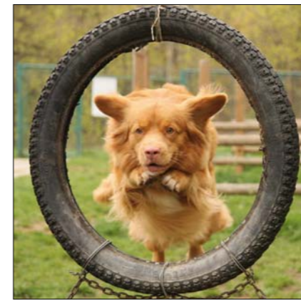
Svůj temperament toller skvěle uplatní při agility.

Tolleři jsou perfektně uzpůsobeni k lovu v tradičním smyslu slova, tak jako ostatní retrievři. Tito psi jsou popisováni jako excelentní lovci. I když bylo toto plemeno vyšlechtěno k lovu vodních ptáků, je také využíváno k lovu mimo vodu. Tolleři jsou stejně spokojeni, když je pach na zemi nebo ve vzduchu. Dobře cvičení psi loví na blízko a neštěkají. ■